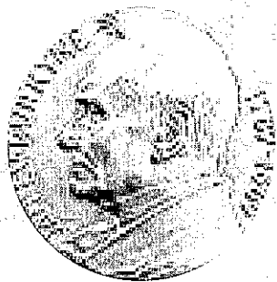
普金希的紀念金幣

醫師則好一些，靠政府發放的薪資每月也只有100US$-300US$。因為俄國還是施行公醫制度，看病免費。而莫斯科又是世界第三貴居住的城市，僅次於東京與倫敦。做醫療從業人員真是十分地可憐。在醫療資源相對不足地時候，他們並不依賴高科技的儀器，取而代之的是發揮了無比的愛心與耐心，與高超的醫術與技能來醫治病人。一些在沒有高科技設備的幫助之下，就活不下去，束手無策的醫師如果知道如此是否也會感到汗顏呢？而台灣未來的醫師們，是否也可以在健保資源逐漸支卵糧之時，也願意放棄自己優渥的薪水，化作病人的醫藥費而換來病人的健康呢？