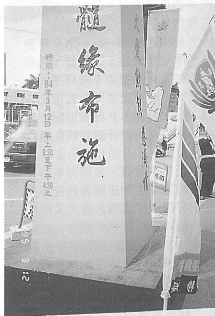
△台中中山堂前的骨髓捐贈活動

以下是我們收集大部分人，對「骨髓捐贈」一事最想知道及最感不安的幾個問題：（摘自第324期慈濟月刊）