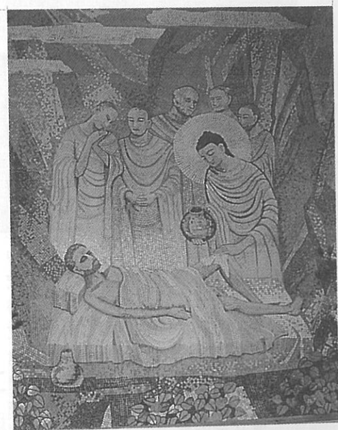
△慈濟醫院大廳旁之佛陀問病圖

在功利現實主義的現今社會，有形的資產重要性被過分強調，卻忽略了無形的精神所能帶給人們心靈上的真實滿足感受，而慈濟所能提供最大的資源就在這裏，或許這正是吸引慈院醫師前來的原因；與理念相同的人共