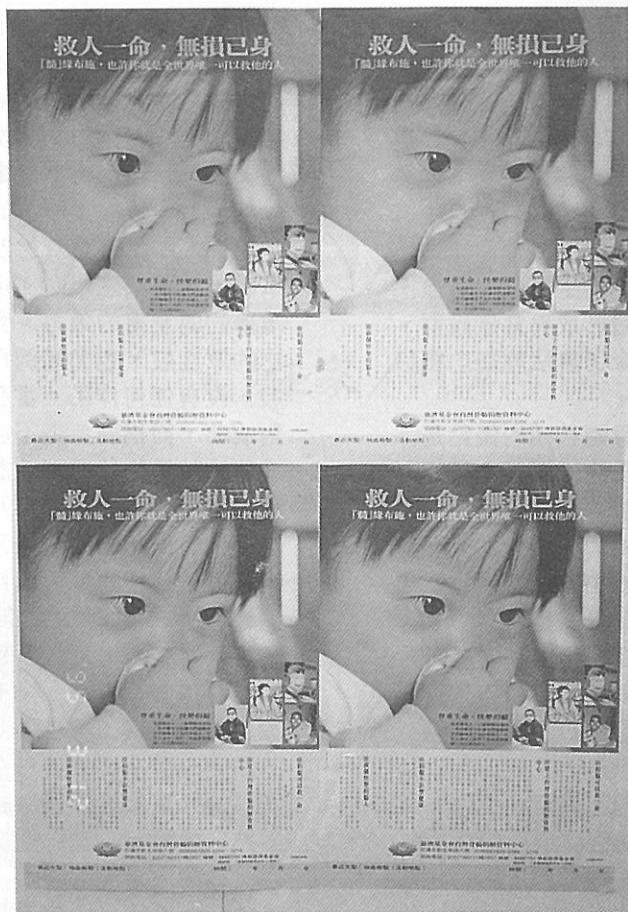
△也許你就是唯一可以救他的人

A：究竟供髓者需要提供多少量的骨髓，必須視病患的體重而定。至於從供髓者身上所抽出來的骨髓液，則絕大部分是血液，骨髓的真正含量僅佔抽取量的十分之一。例如：患者若是小孩，供髓者捐輸的二百c.c.骨髓液，僅有二十c.c.的骨髓，若患者為大人，則所輸入的五百c.c.的骨髓液中，骨髓則是五十c.c.左右；而即使捐輸