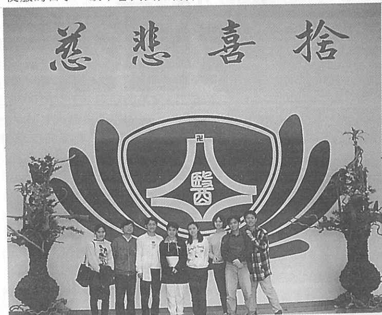
△與慈校學生合影留念