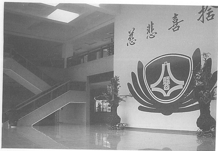
△慈濟醫學院之大廳

本系初期之發展重點在培養醫師專門人才、配合地域性公衛需要，發展區域性醫教系統，著重局部地方需要。此外，並設有分子流行病學研究室。