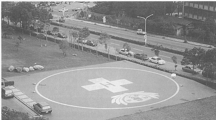
△慈濟醫院的停機坪