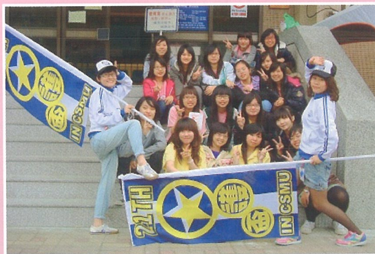
第 21 屆大護年會