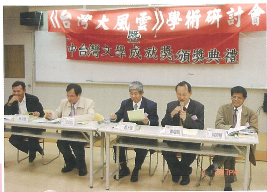
台灣大風雲研討會

本土化與國際化並重則是本系第二個特色：除了強調台灣主體性的課程之外，為配合全球化的學術潮流，本系分三部分加強學生的世界觀。第一部分是語言：本系規定學生在四年內必修 8 學分的英文和日文，藉以增強學生基本的外語能力。第二部份是理論：本系開設許多現、當代西