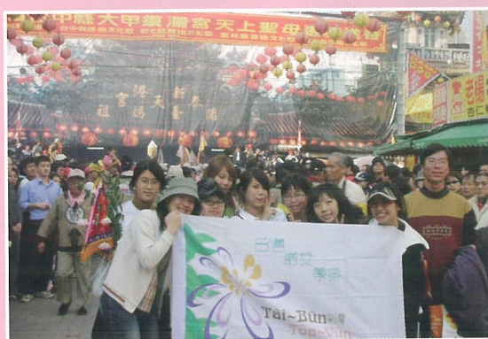
師生參加大甲媽祖遶境活動