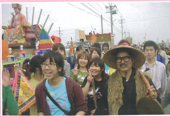
師生參加大甲媽祖遶境活動