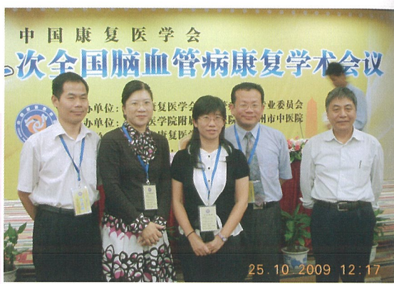
與溫州醫學院學術交流