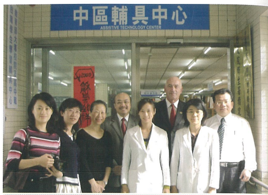
美國生命大學來校參訪交流