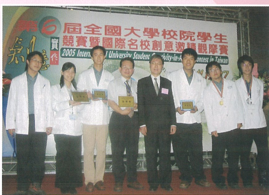
全國大專院校學生創意實作競賽獲獎