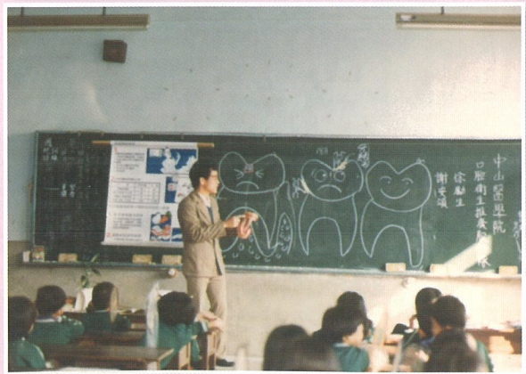
50、60年代口衛隊已至偏遠地區衛教服務