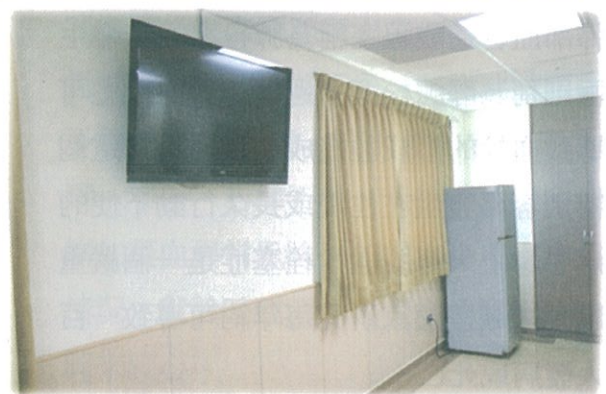
圖二、VIP國際病房有休閒會客區、景觀房可遠眺大台中、衛星電視、電腦、WIFI無線網路、國際電話等設備。