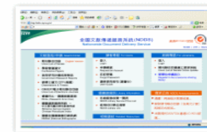
全國文獻傳遞服務系統