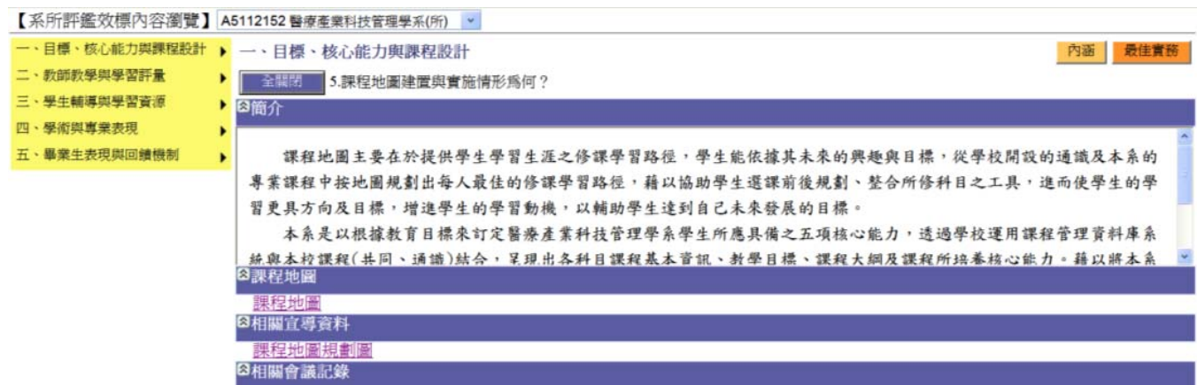
【圖三-2】參考效標內容瀏覽之系統介面