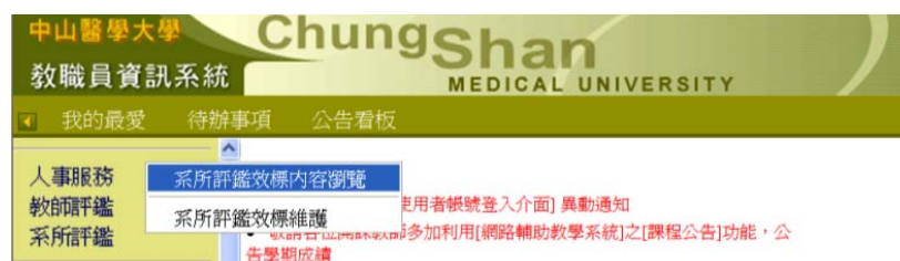
【圖一】系所評鑑資訊系統進入畫面

各系所系秘進入教職員系統時【圖一】，在左手邊將會看到在教師評鑑底下的系所評鑑項目，分別可點選「系所評鑑效標內容瀏覽」與「系所評鑑效標維護」兩項；前者為評鑑效標所有內容呈現之瀏覽，在此未來將開放各系所內容呈現給各系觀摩，可作為各系效標修改的參考學習與依據。後者為評鑑效標內容之增修，可在此將系所評鑑效標、內容或呈現之瀏覽方式作修改動作。