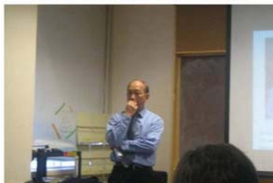
最後討論時BWH學者們提出一些問題，我需要思考一下！回到台灣後居然再寄E-mail來討論，其追求真理之精神，令人欽佩