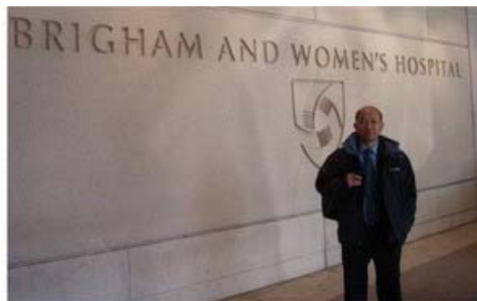
本人剛抵達Brigham and Women's Hospital準備演講

目前哈佛大學三大教學醫院爲麻州總醫院（MGH）、BWH 及 Beth Israel Deaconess Medical Center，此三所醫院在美國醫院排名皆在10名左右，領導美國及世界之醫學進步。