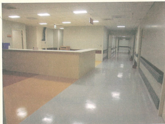
圖一：產科照護中心護理站

本院也經過病歷委員會審核通過生產計劃書，父母在被充分告知的狀況下，對自己的產程和生產有更多了解，透過支持及教育賦權給每一個孕產家庭醫療的相關知識與各種待產醫療服務的優點與缺點，讓產婦及家屬選擇自己想要的生產照護方式，提供懷孕婦女在待產期間友善且舒適的待產環境，同時顧及產婦的情緒隱私，回歸到自然的生產方式，讓婦女感受到被尊重、愉悅的生產經驗。醫療團隊則具有博士、教授等完整資歷