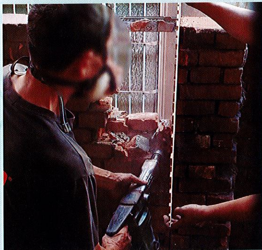
拆除時會有大量粉塵產生