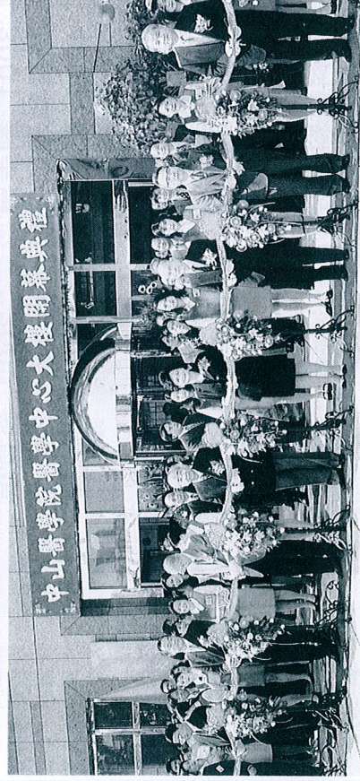
▲董事長與貴賓為開幕典禮剪綵