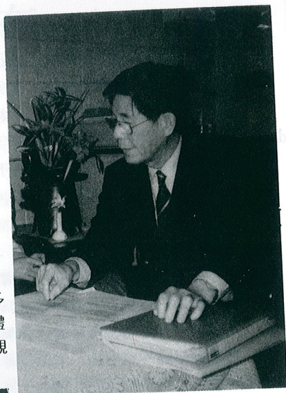
「距這個版面有多少不同大小的字體？讀者只覺得美觀，不會想這麼多」