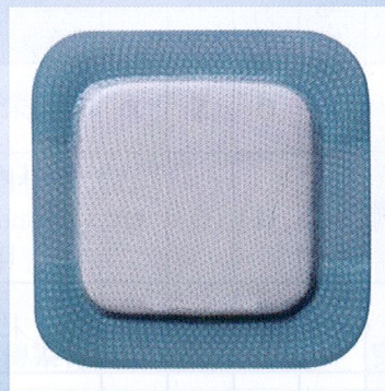
B敷料產品照片(隱去商品名)