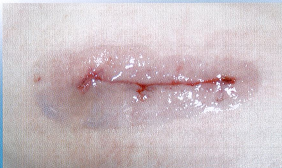
D黏著劑實際使用照片