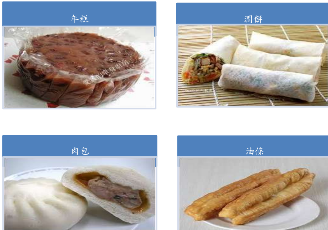
圖一 過年食物類語彙及干擾語彙