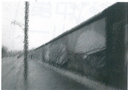
大眾小說應該做的，是順暢地鋪陳文字，讓讀者的意識自然而融入作者想要表達的故事情節，而不是築起一道又一道牆。（九把刀）

比重，該如何座落，但這並不是很具體的數字分配，而是：如具體的，文字在重要程度不一的劇情上，何讓讀者在重要程度不一的劇情上，停留卻不感到煩悶。非常技術化，卻無法精確描述技巧。簡單說就是：設身處地：如果你是一篇好的小說，你會不會很想跳過去。一篇好的小說，說是不會發生太多這種節奏感的動對白，去加速可能沈悶的部份，單純描述劇情的章節而配有一些，對白，當然還有很多方式，清楚、俐落的分段，是初寫者最保險的做法（是的，你是看多了駱以軍等等文學大家落落長擠成一大團的段落，但當你還沒有能力處理這麼豐沛的段落時，謙虛地做好分段是很得體的做法）。