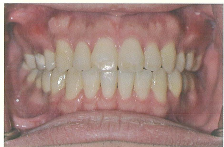
正顎手術牙齒局部照(術後)