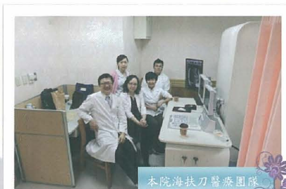
本院海扶刀醫療團隊

接受過海扶刀後，腫瘤體積一般不會立即縮小、消失，由於腫瘤組織發生凝固性壞死，其大體輪廓仍在，但此時的腫瘤已經沒有活性了。經過一段時間後，壞死的腫瘤組織會被身體逐漸吸收、清除，有的可以完全吸收，最終消失；也有的不能完全吸收，會在體內留下一個癍痕。凝固性壞死區吸收的速度與腫瘤部位、個體差異關係很大，有的需要幾個月，有的甚至會持續好幾年。目前海扶刀治療的有效率在95%左右。