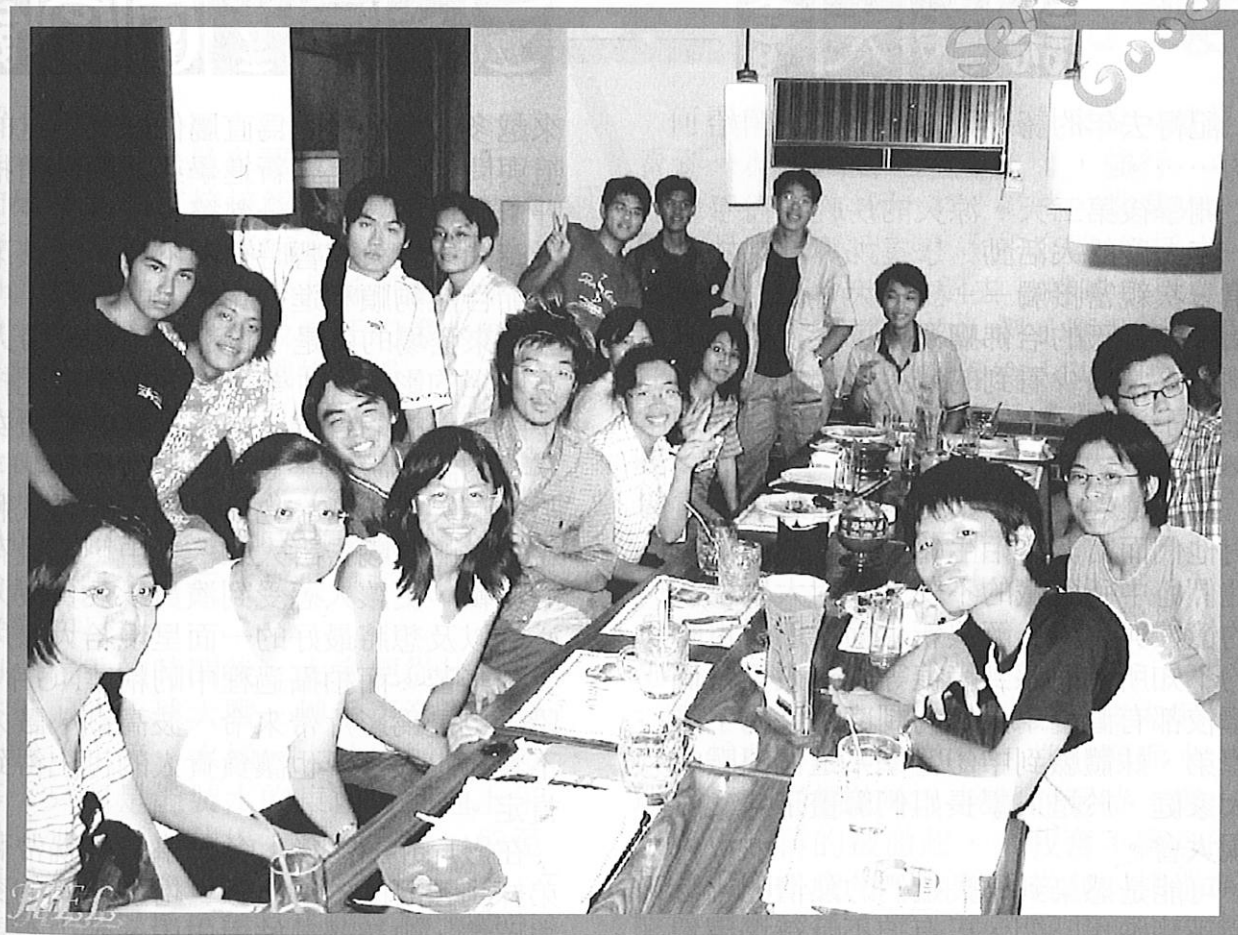
上面這張是中區迎新的照片喔！！