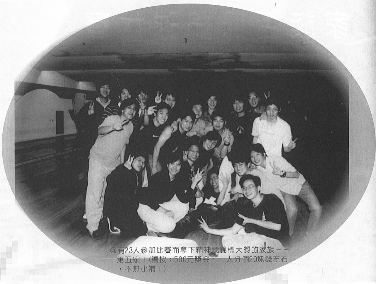
◎有23人參加比賽而拿下精神總錦標大獎的家族——第五家！（編按：500元獎金，一人分個20塊錢左右，不無小補！）

就已經有學弟妹先到場去練習熱身，甚至連會長乃仁等人，於賽前幾天通宵練球到2點，一人狂打9局，打到咳嗽感冒，誓言要抱病拿下冠軍！對於這些保齡球的狂熱者，在此獻上我們最高的敬意！當賽前3分鐘的練球時間一到，所有參賽者像發了狂似的，開始努力瘋狂的練習，甚至連球道上都站滿了人！等到由主辦人倒數5秒，由各家族中最老的學長姐開第一球之後，比賽就正式展開！在比賽的過程中，不時聽到選手們打出全倒時的歡呼、擊掌聲，也有當球和球瓶擦身而過時所發出惋惜聲，或是當學長洗溝時，學弟妹們一片的吐槽聲。當然其中不乏有些有趣的小動作，例如去干擾隔壁道打出火雞的學弟，或是在球道上跳一跳就可以讓快要倒的球瓶倒下……等等。雖名為比賽，但是此次活動主要是以連誼性質的另類大型家聚為主要目標，所以不管打的好不好，選手們