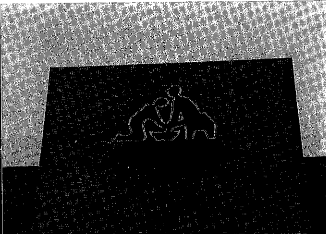
彰基的標誌——耶穌跪著為他的門徒洗腳