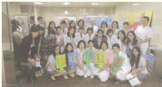
圖一、圍飢特攻隊-全體總隊員

全球糧荒、天災、戰火及兒童生存危機等苦難不斷，台灣世界展望會飢餓三十，不僅關心國外受災民眾，更關懷國內重大災情以及經濟弱勢家庭的急難需要，為處於貧困災禍中的兒童、家庭，帶來生命的契機與希望。透過小小的行動，自身做起從飢餓活動，真正體會飢餓的感受並進一步了解全球約有8億7千多萬人面臨飢餓，甚至每15秒即有一人死於飢餓，然後體會幸福的真諦即是「知足惜福」。活動過後立即的效應，即是每餐食物必定吃光不忍浪費，這應也是參加此活動的最佳附加價值。