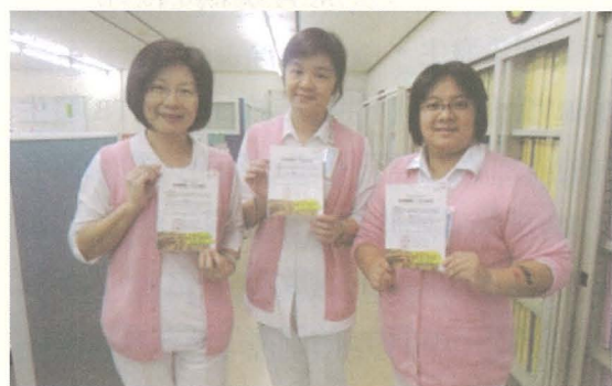
圖二、圍飢特攻隊-頒發證書