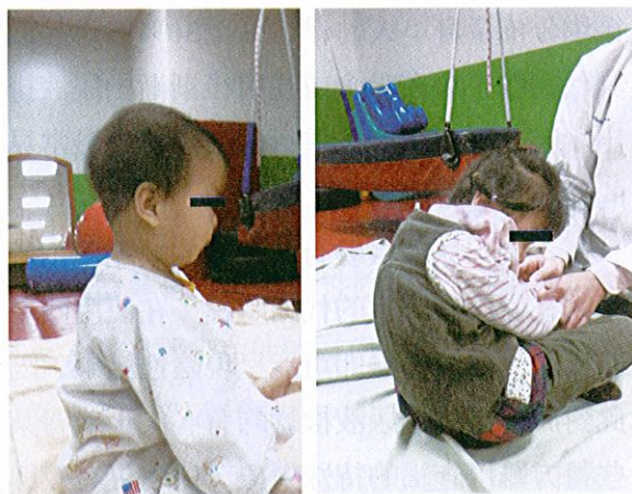
圖一：正確的坐姿 背部肌肉能夠穩定孩子軀幹及維持挺直；協助正確的頭部位置。

經受損後造成下肢肌肉張力異常，尤其大腿後側闊旁肌緊繃，所以他們維持在雙膝伸直的坐姿時，時常是坐在臀部的尾骨處，且身體會往後傾或背部呈現「圓背(round back)」的現象(圖二)。當出現這些異常的坐姿，建議家長們就醫檢查，盡早治療。