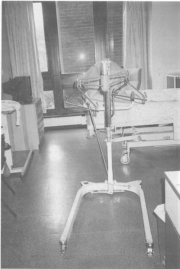
滑車是將病人自床上吊起送到浴室去洗澡的。床上捲起來的是整床的泡綿墊，可以讓病人借回家使用。

十一、洗澡設備 ——不論住院或日間照顧的病人，只要病人想洗澡，護士就會幫病人洗澡，洗澡浴缸或淋浴設備是特製的，病人可以很方便的從躺在病床上整個人平行移進浴缸內，更有一種吊輪可以將病人從病床上吊起，送病人到洗澡室，不僅工作人員很省力，很消瘦的病人也不必承受被翻動，搬動之苦。