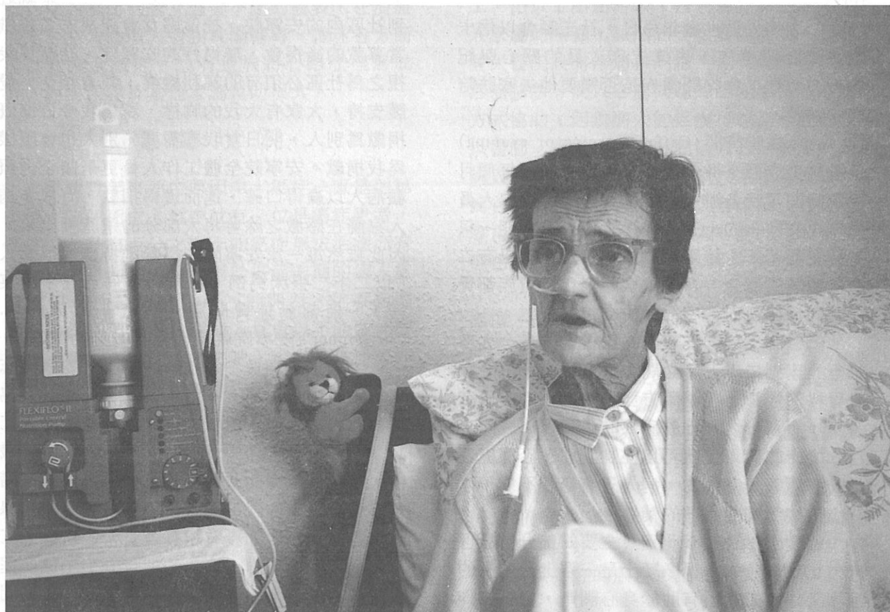
此為食道癌病人，並沒有開刀，獨居在家。Home Care team 定期會去看她。她可以自己裝填流質食物。住處及食物都是政府免費供應。

(七)公關及募款負責人：是全職的相當於單位主管，有幾位兼職的工作人員及很多志工，常在院外奔波執行募款方案。負責人主要的工作是企劃方案，配合聖誕節等節慶而舉行的大型社區募款活動。英國的安寧院都是向政府登記的慈善機構，全國一百多家安寧院都不向病人收費，所有經費靠募款，有的有政府微少的