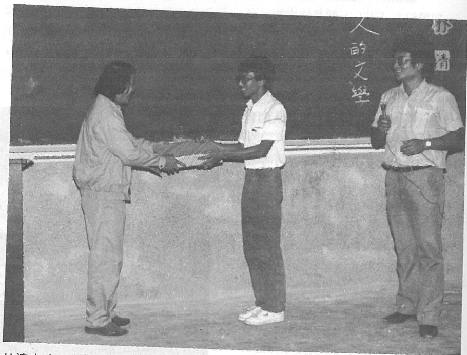
林清玄（左）接受本校致贈紀念品

所以從事創作十幾年，在落筆的時候都要先想：我對事件是不是有真實的認識？是不是有真正的感動和關心？是不是對人心有益的？而「有益」，未必是物質的、功利的、馬上可見的、而是能使讀者感到快慰或減低痛苦、開展視野。同時作為一個鑑賞者也要關心人的世界，才能產生「人的文學」，而因為「人的文學」產生使社會更溫暖。