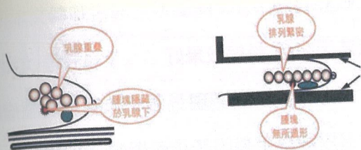
圖四：檢查中壓緊乳房(右圖)與非壓緊乳房(左圖)檢查比較