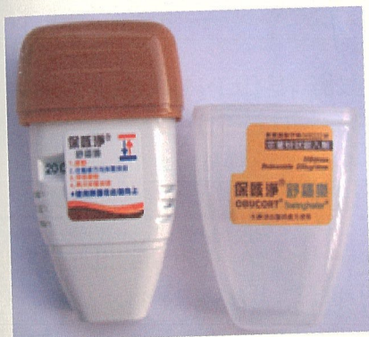
圖左：保咳淨(Obucort®)→藥物商品名 圖右：舒穩樂® (Swinghaler®)→吸入器商品名

細小的藥物分子甩出來，病人吸入時就能有充分的小分子藥物，更容易到達小氣道，理論上效果會更好。