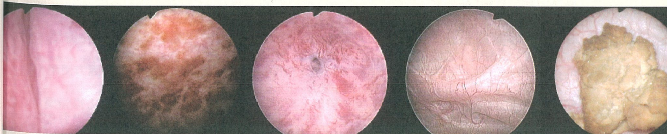
肥大 prostate hyperplasia