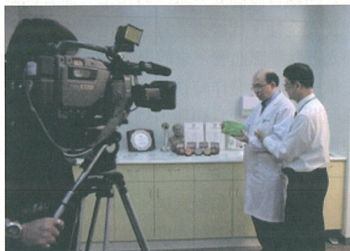
圖一：呂總院長與白主任接受訪問當日實況

非凡台灣發明王節目訂於5/5下午5:25在58頻道播出，敬請全校師生及同仁、校友準時收看。