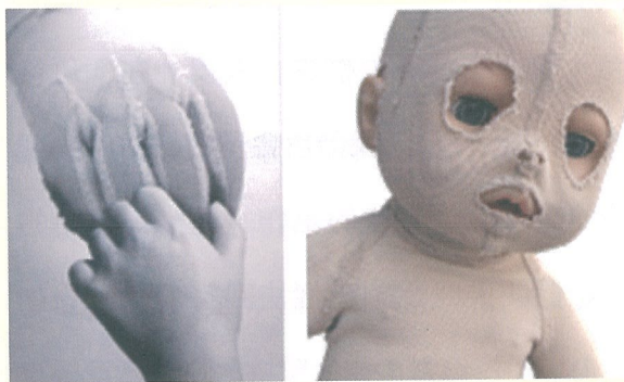
(圖:燒燙傷使用之壓力衣)

針對凸出性疤痕，為了預防疤痕進一步擴大，可以視傷口的大小，選擇合適的加壓治療，範圍較小的可使用如矽膠片、矽膠帶、矽膠軟膏等處理，若是範圍較大的傷口，可能則必須穿戴壓力衣或塑身衣，有時還要視受傷部位而有不同的形式；像是臉部的燒燙傷，可能需要全包覆式的頭套，而手指的部位可能需要手套的包覆等。