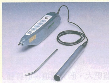
怕針的新選擇-雷射針灸

最後，還是建議治療氣喘請找對中西醫均有一定瞭解的中醫師來調理體質，因為氣喘的西醫長期用藥對預後是很重要的，千萬不可貿然停藥，否則嚴重的急性發作是會有生命危險的，透過中西醫整合醫療的幫忙，病友除可治療氣喘之外，更可以趁此機會，將過敏性鼻炎，或者腸胃功能差、胃口不佳一併治療，一舉數得。