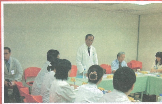
多次的開會，皆是為了達到最好的防疫成果