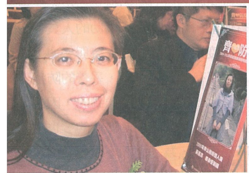
授獎前，又興奮又緊張的心情