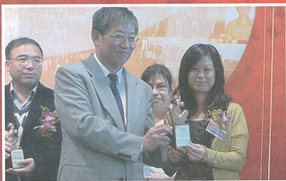
這一刻，讓我對推行防疫更有信心