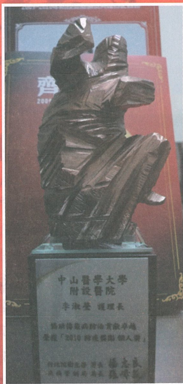
甜蜜的負擔，得來不易的獎盃

防疫業務的推行，主要是為了要有效的防止疾病之傳播，您耳熟能詳的流行性疾病，例如登革熱、腸病毒、H1N1等等，都屬於防疫工作的一項，因此，防疫業務的推動，實屬不易，得獎的肯定，對我們更是一份支持的力量，在活動照片中，我們的感謝與自信，洋溢在我們的微笑裡，讓我們藉由照片，與您一同分享，這份榮耀與喜悅。