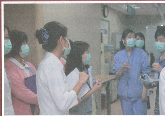
院內人員防疫的教育與推動