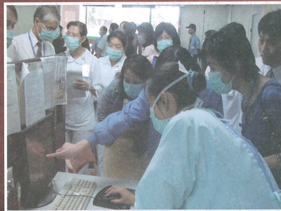
防疫的通報，也是防疫業務重要的一環