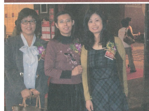
得獎的喜悅，讓我們忘了防疫推動的辛苦