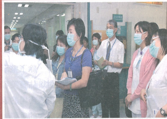
防疫人員用心的推廣與教學