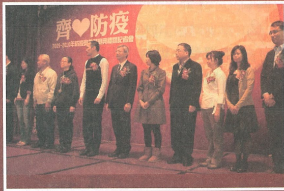
來自各界的夥伴們，很高興可以和您們一同得獎，因為有你們，推動防疫，我們並不孤獨