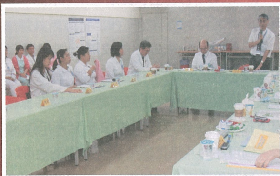
精密的團隊，商議防疫業務之推動

一枝草，一點露，得獎，絕非僅靠一次的運氣，而是有背後多次的努力與耕耘，才能有今天豐碩的成果，得獎者的付出，的確值得肯定，除此之外，我們也感謝，感染控制室優良團隊所有人的支持，還有各單位的配合，才能使防疫工作順利推行，獲得今日各界的肯定，透過無聲的照片，與您一同分享，我們走過的點點滴滴。