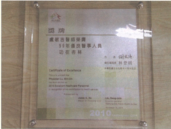
圖：「99年優良醫事人員-功在杏林」獎狀