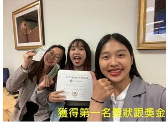
獲得第一名獎狀跟獎金