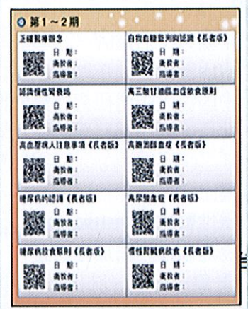
圖三、QR code 及國台雙語導讀衛教轉盤