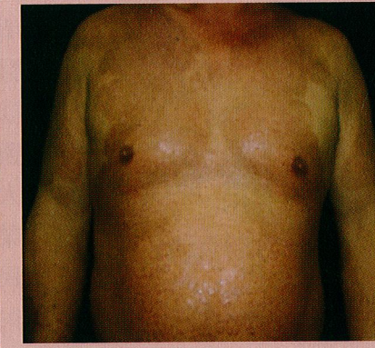
乾癬好好控制，可以得到有效的治療