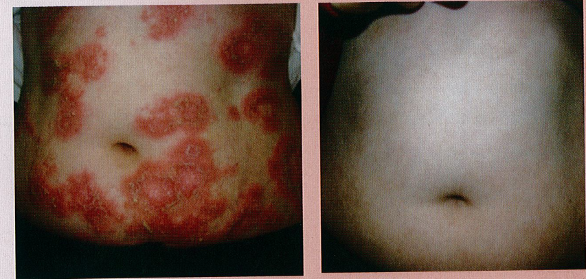
近年來因為生物製劑的崛起，乾癬患者得到安全性高的治療，是乾癬患者的一大福音。

成達到乾癬緩解效果；第二、需留意患者本身是否合併有肺結核，或者是B型肝炎或C型肝炎等病況，少數個案可能因為使用生物製劑而造成肺結核復發或病毒性猛爆性肝炎。另外，懷孕哺乳婦女及癌症患者仍不建議使用。