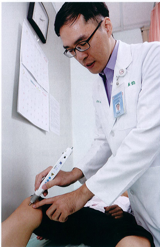
醫師為退化性關節炎病患以雷射針灸治療

在手術誘導麻醉前15分鐘與抵達恢復室15分鐘各治療一次，照射於內關穴可降低25%術後噁心嘔吐發生率。