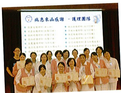
圖一病患來函感謝

行文至此，望向窗外看見即將完工的捷運及鐵路高架工程，看著已漸成型的13期重劃，看著熙來攘往的學生及教職員工，一切都是如此朝氣蓬勃，相信中山也會如此，在穩健成長中邁入2016年，「成為民眾最信賴的醫學中心」。祝福大家在新的一年里能事事順心，猴年吉祥如意，幸福美滿。謝謝大家。