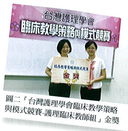
圖二「台灣護理學會臨床教學策略與模式競賽-護理臨床教師組」金獎