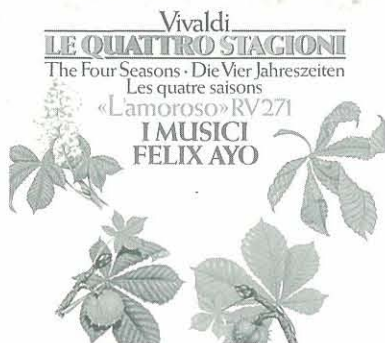
▣ 巴羅克時期義大利作曲家維瓦第及其作品「四季」。