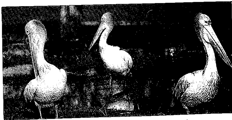
◎弗格水霸是水上飛鳥的天堂，看這些塘鵝多麼怡然自得！

塔斯馬尼亞省，是澳洲的島省，位於澳洲東南海面上。島上有高山、湖泊、森林、寧靜的山谷、海灘、峽灣、岬角等各種不同的天然景觀，且四季分明，非常適合度假旅遊。荷巴特爲該省的首邑，澳洲的首座綜合購物場便是興建在此。